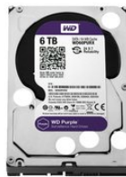
WD60PURX SATA Festplatte 6 TB