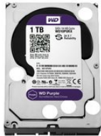
WD10PURX SATA Festplatte 1 TB