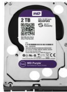
WD20PURX SATA Festplatte 2 TB